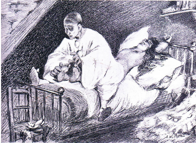
Figure 3 : Adolphe Willette, « Pierrot assassin de sa femme », paru dans Le Pierrot du 7 décembre 1888.