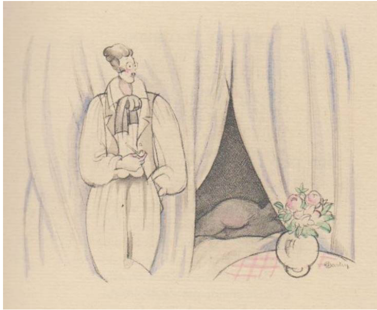
Figure 1 : Charles Martin, « Pierrot fumiste », gravure illustrant l'ouvrage de Jules Laforgue.

Il tire son titre de planches parues dans Le Chat Noir , dessinées par Adolphe Willette (1882), qui publiera quelques années plus tard Pauvre Pierrot (1887), anthologie des centaines de pierrots réalisés par l'illustrateur. Ce dernier nous montre le personnage ivre, adepte des jeux d'argent, vagabond, pendu ou dansant à l'arrivée du choléra. Parfois (c'est un signe des bouleversements qui s'opèrent dans son âme), le personnage de Willette troque son éternelle blouse blanche couleur de lune pour une redingote noire comme la nuit et la mort.