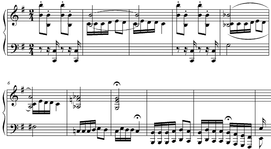
Figure 15 : Claude Debussy, Pierrot , m. 1-10.

En effet, non contente d'être la première note jouée au piano et la dernière qui soit chantée, sa présence devient criante lorsqu'elle vient perturber la première présentation du thème de Pierrot (« Au clair de la lune ») en do majeur (mesure 2). Considérant, ainsi, que si représente Debussy et do Pierrot, nous constatons que les mesures d'introduction mettent en scène la progressive incarnation du personnage par le musicien.