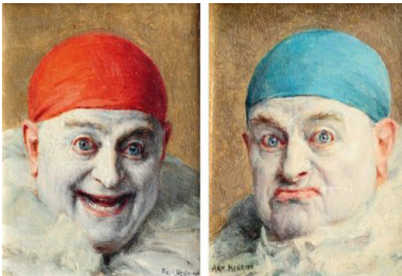
Figure 8 : Armand Henrion, Autoportrait au Pierrot content et Autoportrait au Pierrot mécontent. Deux huiles sur panneau. 18 x 14 cm.

En outre, certains peintres du tournant du siècle ont cédé à la tentation de l'autoportrait en Pierrot, comme Georges Rouault, Amedeo Modigliani, Zinaïda Evgueniévna Serebriakova ou Armand Henrion 13 . D'ailleurs, comme le souligne Michel Beaujour, l'univers métaphorique du théâtre, auquel appartient Pierrot, est régulièrement convoqué par les auteurs se livrant à d'explicites autoportraits (Beaujour 1980, p. 292-293). Ainsi, par exemple, Barthes explique : « L'effort vital de [Roland Barthes par Roland Barthes] est de mettre en scène un imaginaire : "Mettre en scène" veut dire : échelonner des portants, disperser des rôles, établir des niveaux et, à la limite : faire de la rampe une barre incertaine » (Barthes 1975, p. 109).