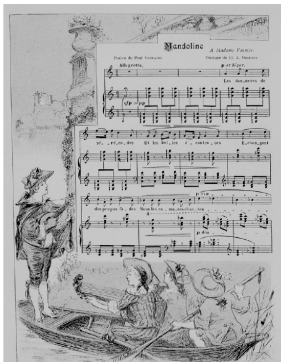
Figure 9 : Claude Debussy, Mandoline, illustré par Willette dans La Revue Illustrée 109.