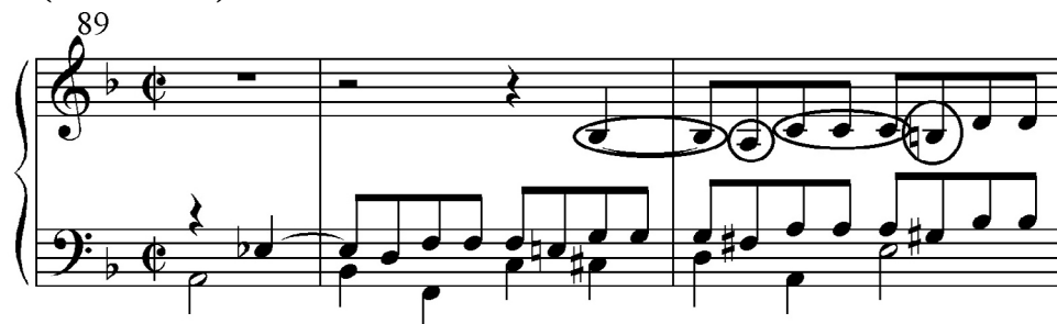
Figure 12 : Jean-Sébastien Bach, Die Kunst der Fuge , Contrapunctus 11 a 4, m.89-91 : le motif B-A-C-H.

Lorsqu'un compositeur souhaite indiquer sa présence dans ses œuvres, voire dresser son autoportrait, le moyen le plus commode est d'utiliser l'alphabet musical. En effet, la désignation des notes allemande – tout comme l'anglo-saxonne –, passe par des lettres, en commençant par la (A), ce qui permet de se livrer à une transposition sonore des noms. Ainsi, « Bach » donne un motif à quatre notes : si bémol (B) – la (A) – do (C) – si bécarre (H). Le compositeur l'utilise par exemple à la fin de l' Art de la fugue (BWV 1080).