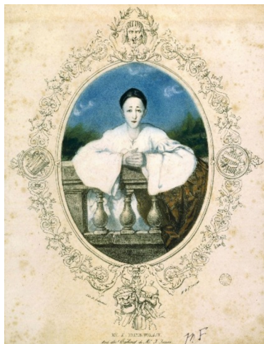
Figure 5 : Auguste Bouquet, Jean-Gaspard-Baptiste Deburau, v.1830.

Si c'est un Pierrot glouton que Debussy brosse dans Pantomime d'après Verlaine (« Pierrot, qui n'a rien d'un Clitandre/Vide un flacon sans plus attendre/ Et pratique, entame un pâté »), ici, c'est l'amoureux qui est à l'honneur. En la matière, parmi les personnages de la commedia dell'arte , Pierrot est l'éternel perdant d'un trio amoureux l'associant à Colombine et à Arlequin. Ainsi, si dans le poème de Banville, Debussy a participé aux « noces d'Arlequin », c'est certainement pour y constater avec dépit la victoire de son rival sur le cœur de Colombine – d'où l'indifférence de ce personnage sentimental aux avances d'une « fillette au souple casaquin ». Double et projection de la lune, il transforme le croissant de l'astre en « cornes de taureau » du cocu. Si l'amertume se lit en filigrane dans ce poème, elle est sans conséquence : avant que les Décadents ne s'en emparent, Pierrot est un passif, rêveur et mélancolique, pâle et solitaire. C'est ainsi que le représente Banville.