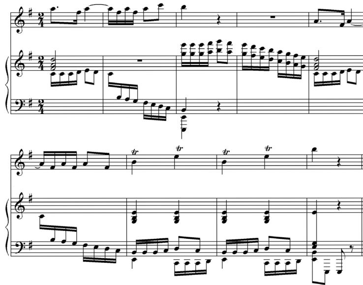
Figure 18 : Claude Debussy, Pierrot , m.53-61.

Une dernière manifestation de l'association de Debussy ( si ) et de Pierrot ( do ) se rencontre dans la coda. En effet, tandis que la chanteuse vocalise – ce chant sans texte, survenant juste après avoir mentionné « Jean-Gaspard Deburau », étant sans doute un clin d'œil à l'art sans parole des mimes – le pianiste enchaîne « Au clair de la lune » tantôt sur la tonique mi en sixtes parallèles (dont on a vu comment le si y était mis en valeur), tantôt sur do (sa tonalité d'origine) harmonisé sur le VII e degré de mi (mode de la). Cette alternance du si et du do , qui rappelle celle de l'introduction, devient très criante lors des trois dernières mesures, où les premières notes du thème sont jouées en imitation à la basse (rappelons qu'il s'agit de la tessiture de Debussy), sur si ou sur do . Ainsi, jusqu'à la fin de la mélodie, Debussy aura joué avec l'ambivalence propre au poème entre le personnage et l'artiste.