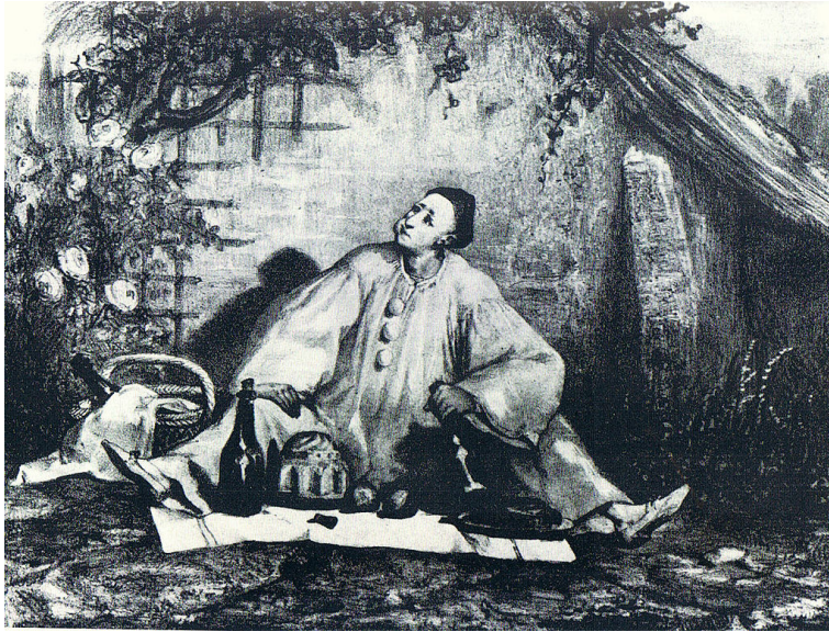
Figure 6 : Auguste Bouquet, Le Repas de Pierrot (Jean-Gaspard Deburau en Pierrot gourmand), v.1830.

pierrots, l'incarnation du personnage sur scène 11 .